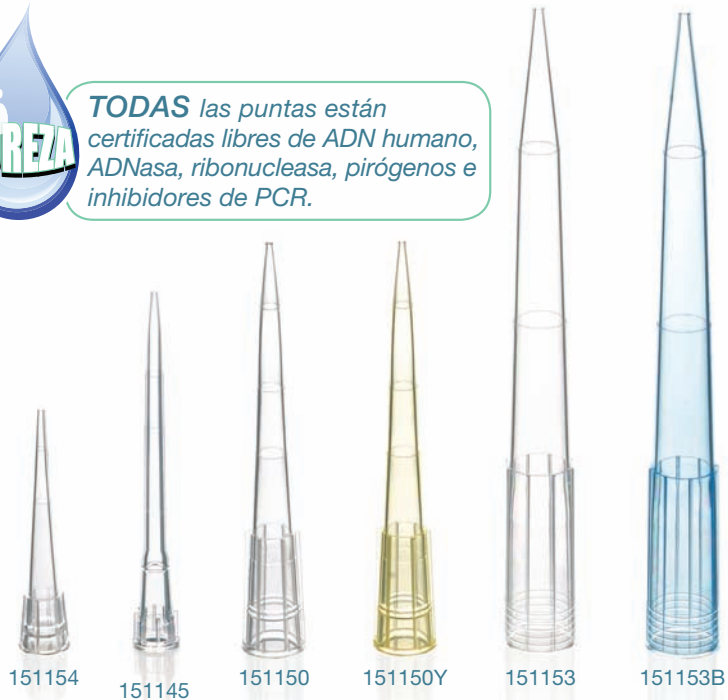
Puntas en tamaño real