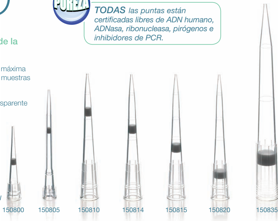
Puntas en tamaño real