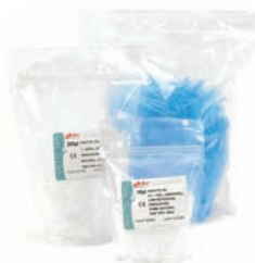
Bolsas no estériles