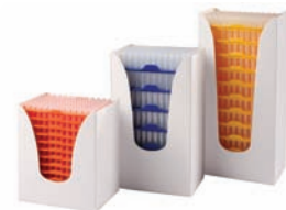
Recargas no estériles