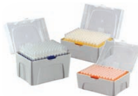
Cajas estériles o no estériles