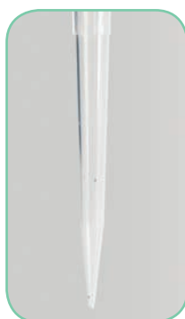
Punta de Baja Retención de Globe Scientific